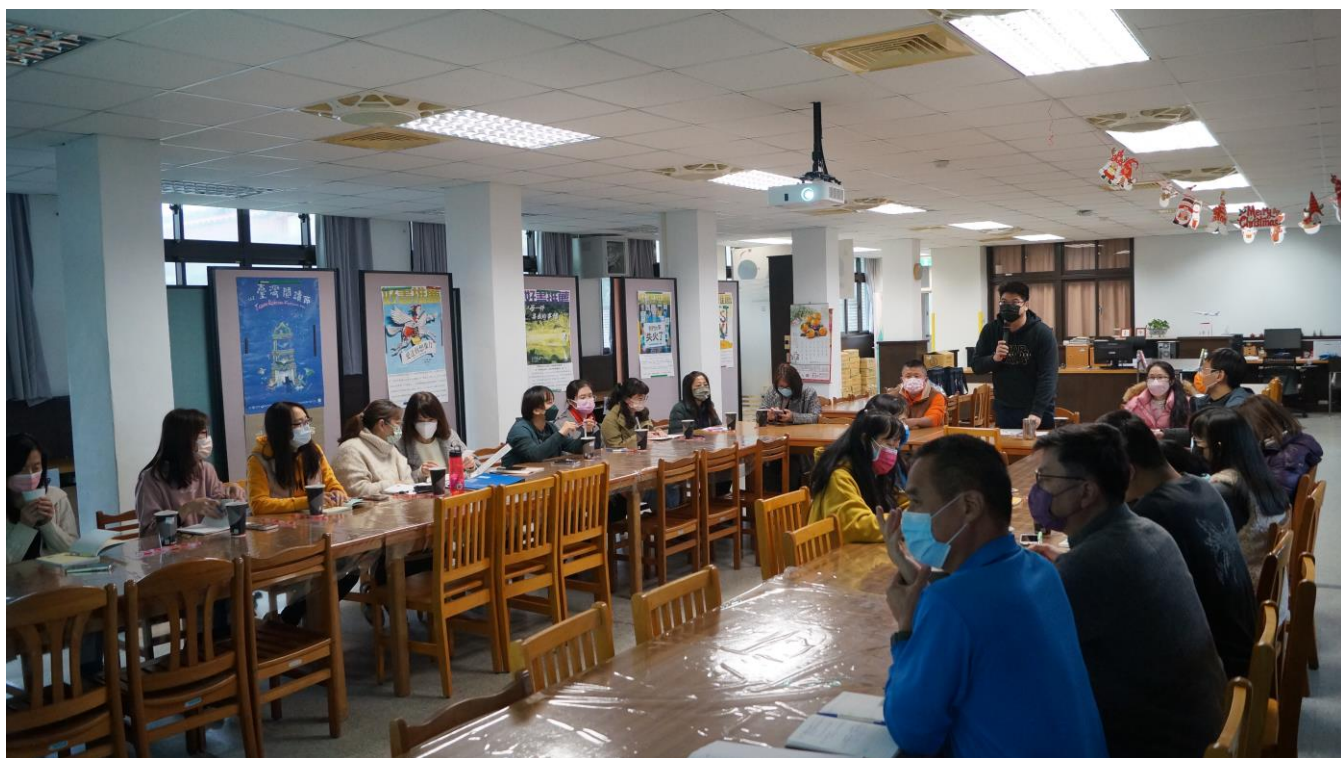
校長感謝老師對學生健康體位計畫的執行